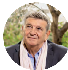
Jean-Marc Borello Président du directoire du Groupe SOS

Notre conviction : les cafés viables sont des cafés adaptés à leur commune. Les ruralités sont contrastées – l'ADN de 1000 cafés est de co-construire des cafés qui reflètent les forces et besoins du territoire. Chaque lieu est conçu sur-mesure, en impliquant les habitants dès la genèse du projet.